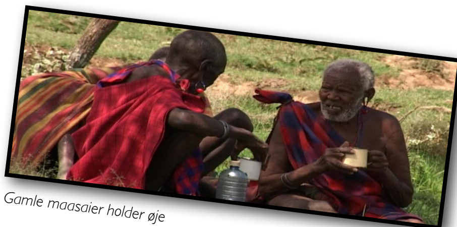
Gamle maasaier holder øje